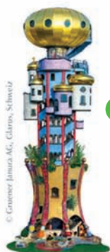
KUCHLBAUER TURM EIN HUNDERTWASSER ARCHITEKTURPROJEKT GEPLANT UND BEARBEITET VOM ARCHITECT PETER PELIKAN